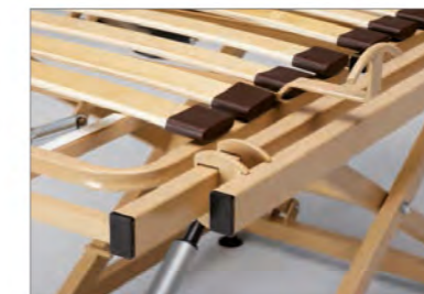
Verbreiterungsschiene 5 cm