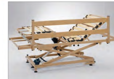
Seitenschutz (auch nachträglich montierbar)