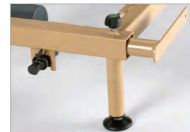
Adaptierbare Standfüße zur Erhöhung der niedrigsten Position (+ 7 cm)